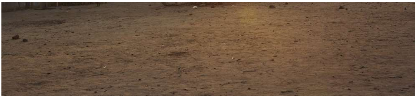
Freetown, Sierra Leone.

“We cannot sit back and look on while what happened during Ebola repeats itself. We cannot sit and wait for foreign magazines to go to print in international news about how we allowed our girls to be violated during this period, and how rape and sexual assault increased, and how we did nothing to stop it.”